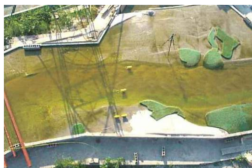
河川水理模型実験