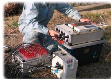
高密度電気探査装置