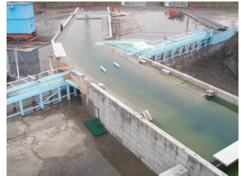
河川水理模型実験