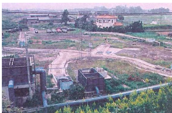
つくば実験センター全景