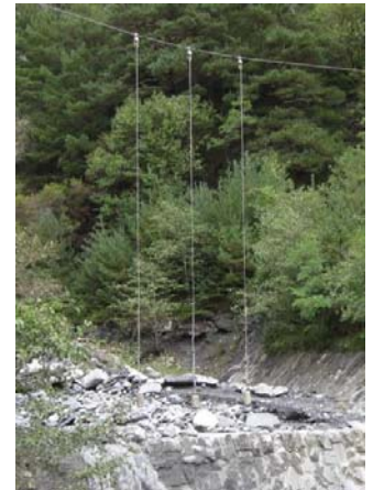
Saint-Julien 溪 (左:工事前 1898 年,中央:工事後 1903 年 6) ,右:現在 2014 年)