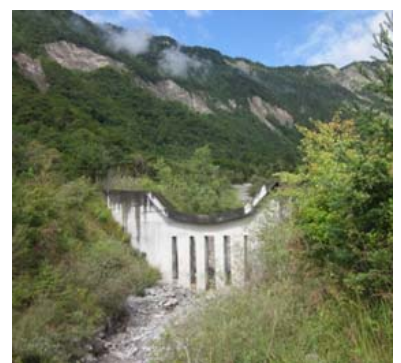
上流の石積堰堤 (左: 1921 年撮影, 右: 現在 2014 年)