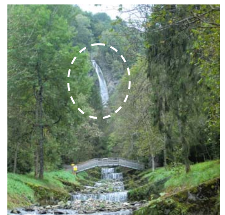
現在 (2014 年) の隧道吐出部と流路工