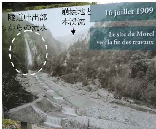
工事完成間近のモレール渓 (1909 年)