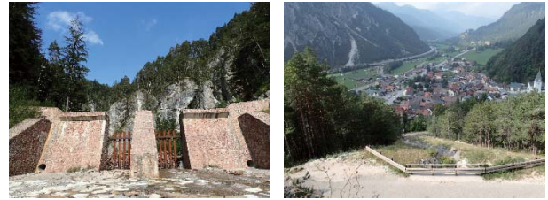
写真3 ウッカ溪(C)の透過型堰堤と保全対象となる扇状地