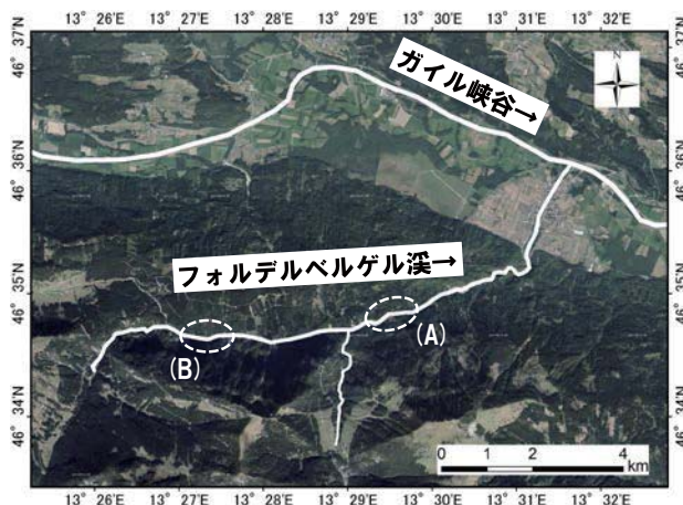
図2 フォルデルベルゲル溪周辺の空中写真

図2中の(A)区間では、近年堰堤が集中的に整備されている。現地では5基の堰堤を確認したが、竣工年を堤銘板で把握できた4基の堰堤は、下流からそれぞれ2009年、2012年、2013年、2016年となっている。これらの上流に、更に6基の堰堤を整備する予定とのことである。堰堤は鉄筋コンクリート構造であり、上流側が鉛直で下流側が2分勾配で施工されている。水通し部に庇構造が設けられている。袖小口勾配は、各堰堤サイトの条件に応じて決められており画一的になっていない。水通し部の保護として、エッジ部に鉄・石材等が利用されている。オーストリアでは堤体は鉄筋コンクリートであり、天端の厚さは日本の堰堤と比べて薄い。(写真1)