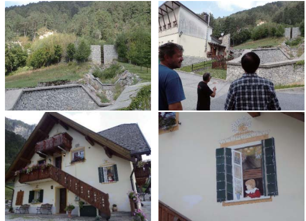
写真4 マルボルゲット(D)の溪流保全工と外壁に描かれた窓の絵