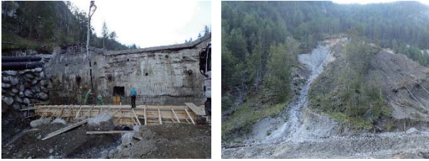
写真2 (B) 区間での堰堤補修の状況と右岸崩壊の状況