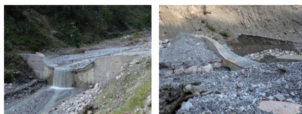
写真1 (A) 区間に設置されている堰堤 (左: 2009年竣工, 右: 2013年竣工)

(B)区間においては、1960年ごろに施工された古い堰堤を嵩上げするための下流面への腹付工事が行われていた。堰堤直上流の右岸に崩壊地があり、既設堰堤は満砂状態であった。(写真2)